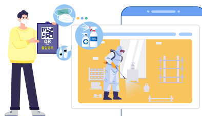
방역활동 작성(간단한 내용, 사진)

자세한 사항은 체육시설알리미( www.spoinfo.or.kr )를 확인바랍니다.