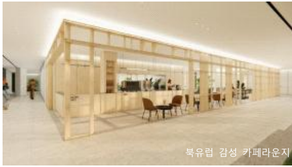
북유럽 감성 카페라운지