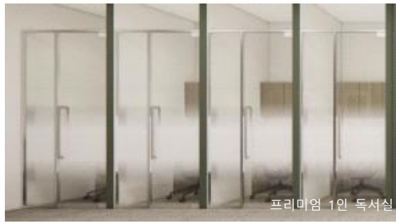
프리미엄 1인 독서실