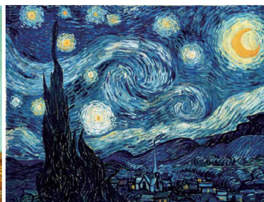
〈별이 빛나는 밤〉1889. 캔버스에 유화, 뉴욕근대미술관

비극이 일어난다. 그 날도 고흐와 다툼 고흐는 극심한 환청으로 인해 면도칼로 자기 귀를 자르고 만다. 두 사람의 강렬한 개성으로 공동생활은 2개월 만에 막을 내린다.