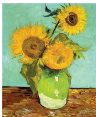
〈해바라기〉1888. 캔버스에 유화. 미국 개인소장

고흐는 남프랑스 아를에서 같이 작업할 친구를 구하던 중 고갱을 만나게 되었다. 고흐와 함께 작업하고 싶어 작업실을 구하고 그를 위해 자신이 그린 해바라기를 방에 걸어 주었다. 꿈에 그리던 고흐와 생활이었으나 예술에 대한 의견 차이, 생활습관 등의 차이로 자주 다투기를 반복한다. 결국 크리스마스에