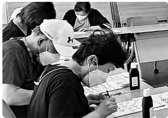
▲ 갈포행복마을센터 : 수채화와 함께 하는 캘리그래피

더(The) 배움학교로 활용하고 있는 또 하나의 장소로 ‘갈포행복마을센터’가 있다. 송정동 광어골