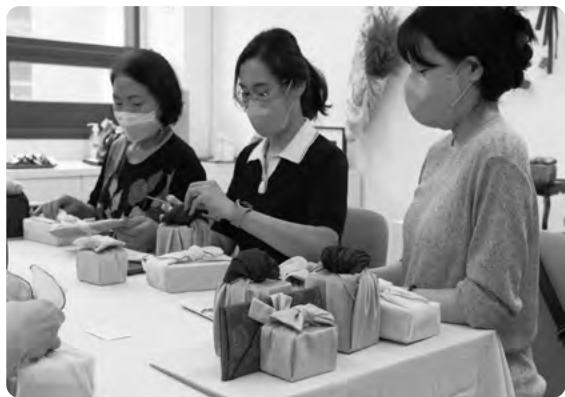
▲ 보자기 연 : 보자기 아트

해운대구는 지역내에 있는 공방이나 카페 등 유휴공간을 활용해 ‘더(The) 배움학교’라는 평생교육을 운영하고 있다. 현재 총 10개의 공간에 20개의 프로그램을 운영하고 있다.