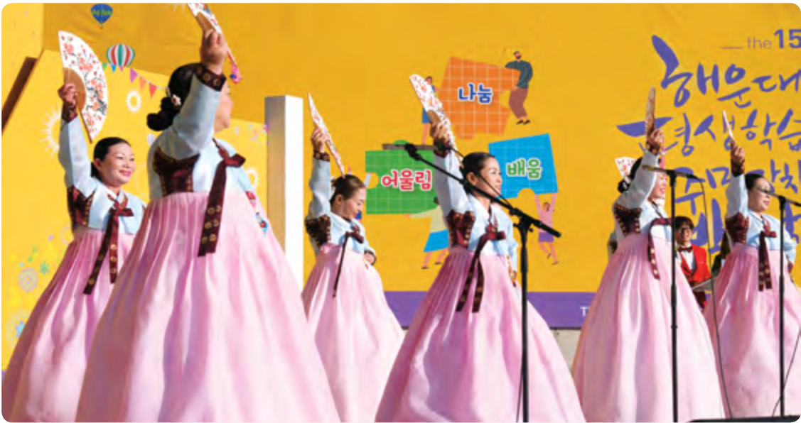
▲ 반송1동 주민자치회에서 남도민요 공연을 선보이고 있다.

제15회 해운대구 평생학습 & 주민자치 박람회가 지난 10월 21일 좌동 대천공원 야외광장 일원에서 열렸다. '평생학습, 우리는 행복 충전 중'이라는 주제로 해운대구 18개동 주민센터와 평생교육기관, 단체가 참여해 전시와 체험부스를 운영하고 주민자치 경연대회를 열었다. 이번 경연대회에서는 재송2동이 생활댄스 공연으로