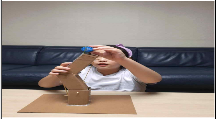
반송지역 초중학생 영어캠프