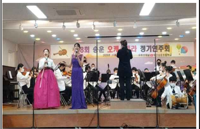
초등 방과후 동아리 활동