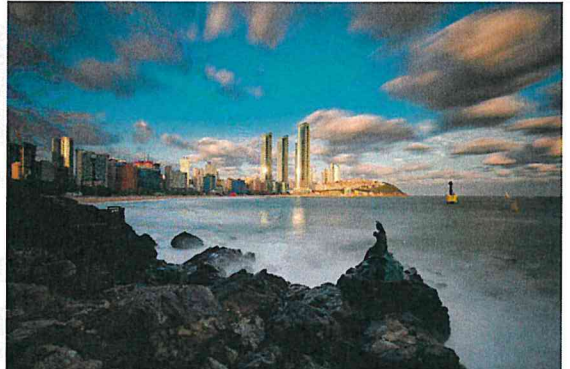
바다를 지키는 인어상 (이**)