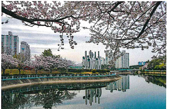
대천공원의 벚꽃 (전**)