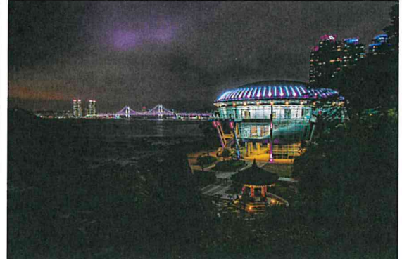
누리마루 야경 (조**)