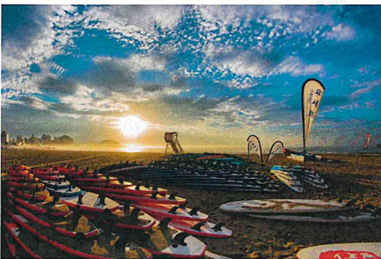
송정 바닷가의 여유 (권**)