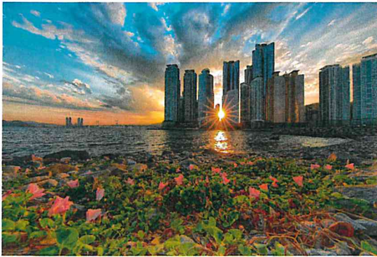
일몰 속 갯메꽃 (강**)