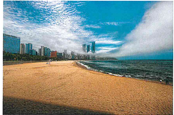
사람보다 해무 (강**)