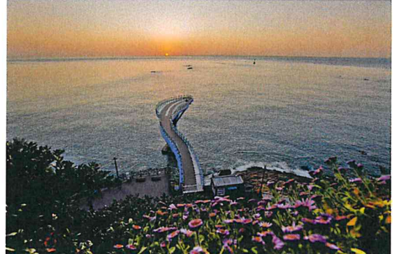
다릿돌전망대 일출 (박**)