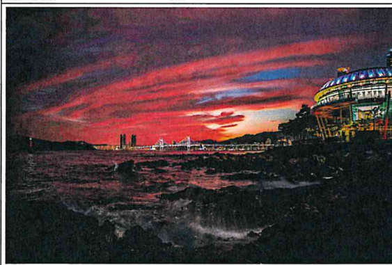
노을 진 누리마루 해변(김**)