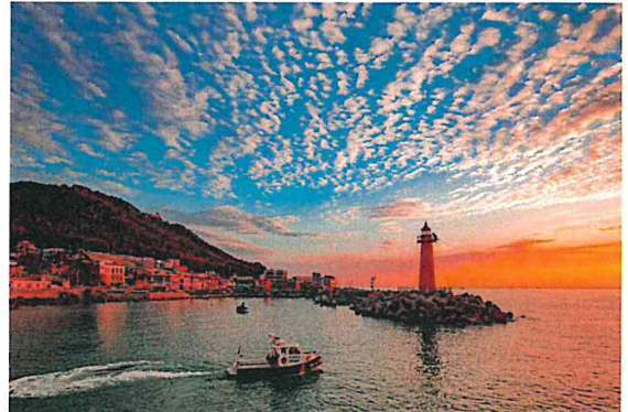
청사포의 새벽 (이**)