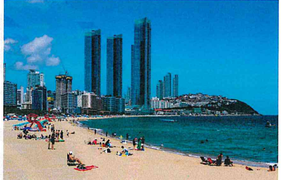
여기는 관광천국 (손**)