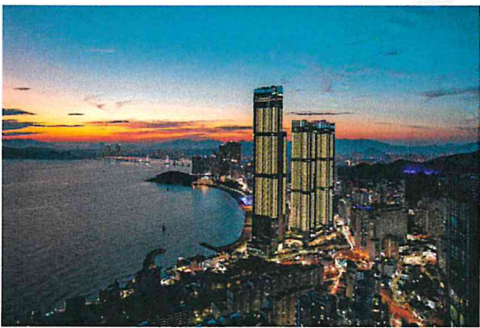
화려한 도시의 밤 (이**)