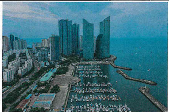
시원한 마린시티의 전경(김**)