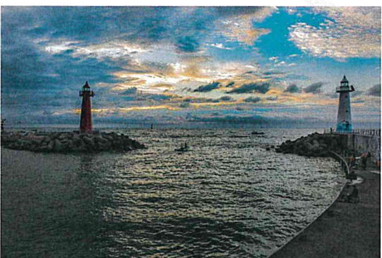
청사포 쌍둥이등대 (심**)