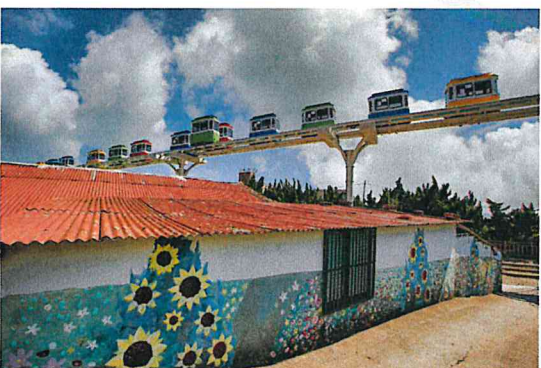
청사포 해바라기 골목길 (장**)