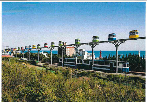
블루라인 파크 (나**)