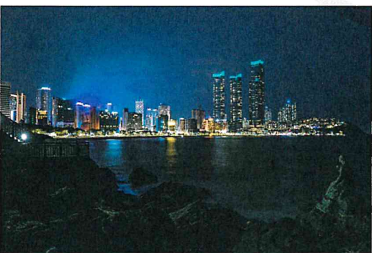
해운대의 밤 (김**)