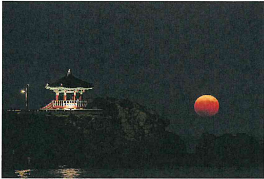
송정으로 월출 보러오세요 (남**)