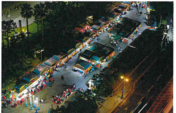
해운대 포장마차촌 (이**)