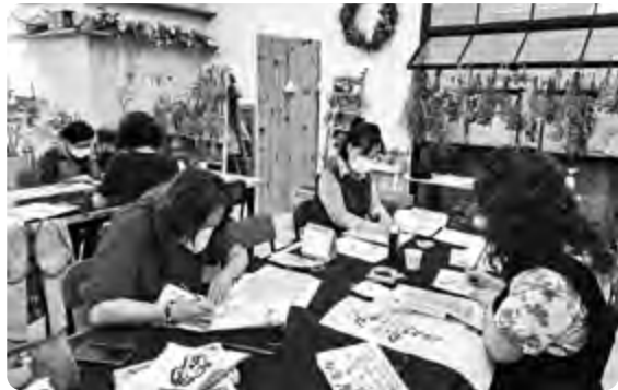
어울림 행복학습센터에서 열린 캘리그래피 강좌.

해운대구는 올해도 5개 행복학습센터에서 각 센터의 특징에 맞는 여러 강좌를 개설한다. 4월부터 11월까지 가족, 장애인, 노인, 여성 등 대상에 맞춰 직업능력 교육, 인문교양, 문화예술 분야로 나누어 진행한다.