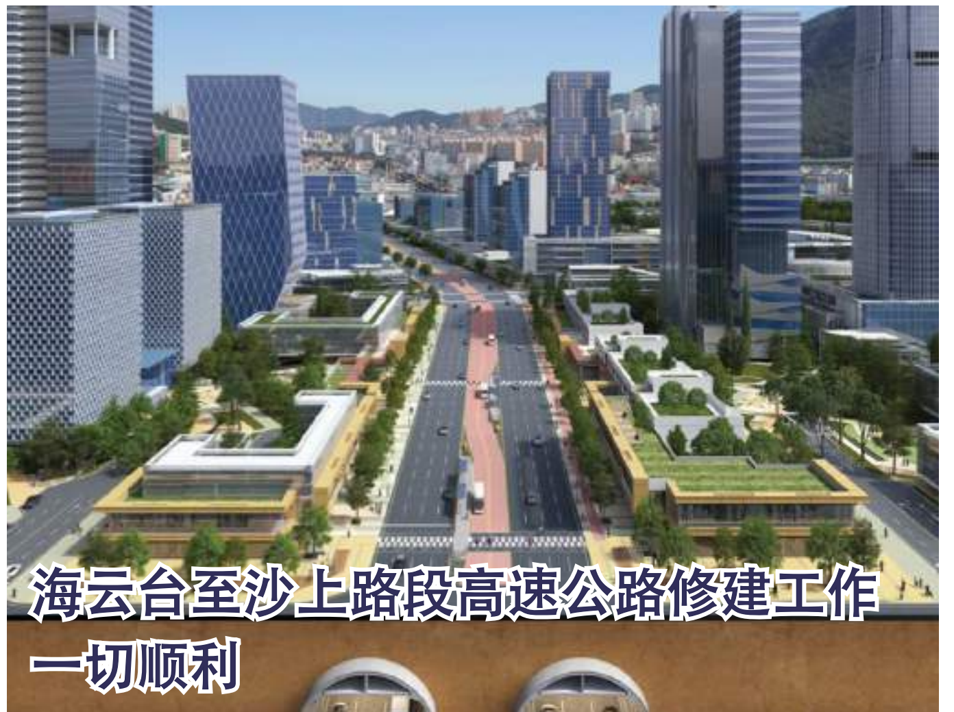
海云台至沙上路段高速公路修建工作一切顺利

深部地下空间施工建设实现东釜山圈和西釜山圈的贯通，有助于解决原有公路习以为常的交通拥堵问题。从栽松洞至北区万德洞路段，修建一条长9.62公里的双向四车道地下道路，施工建设正如火如荼地进行，目标是于2024年11月实现通车。