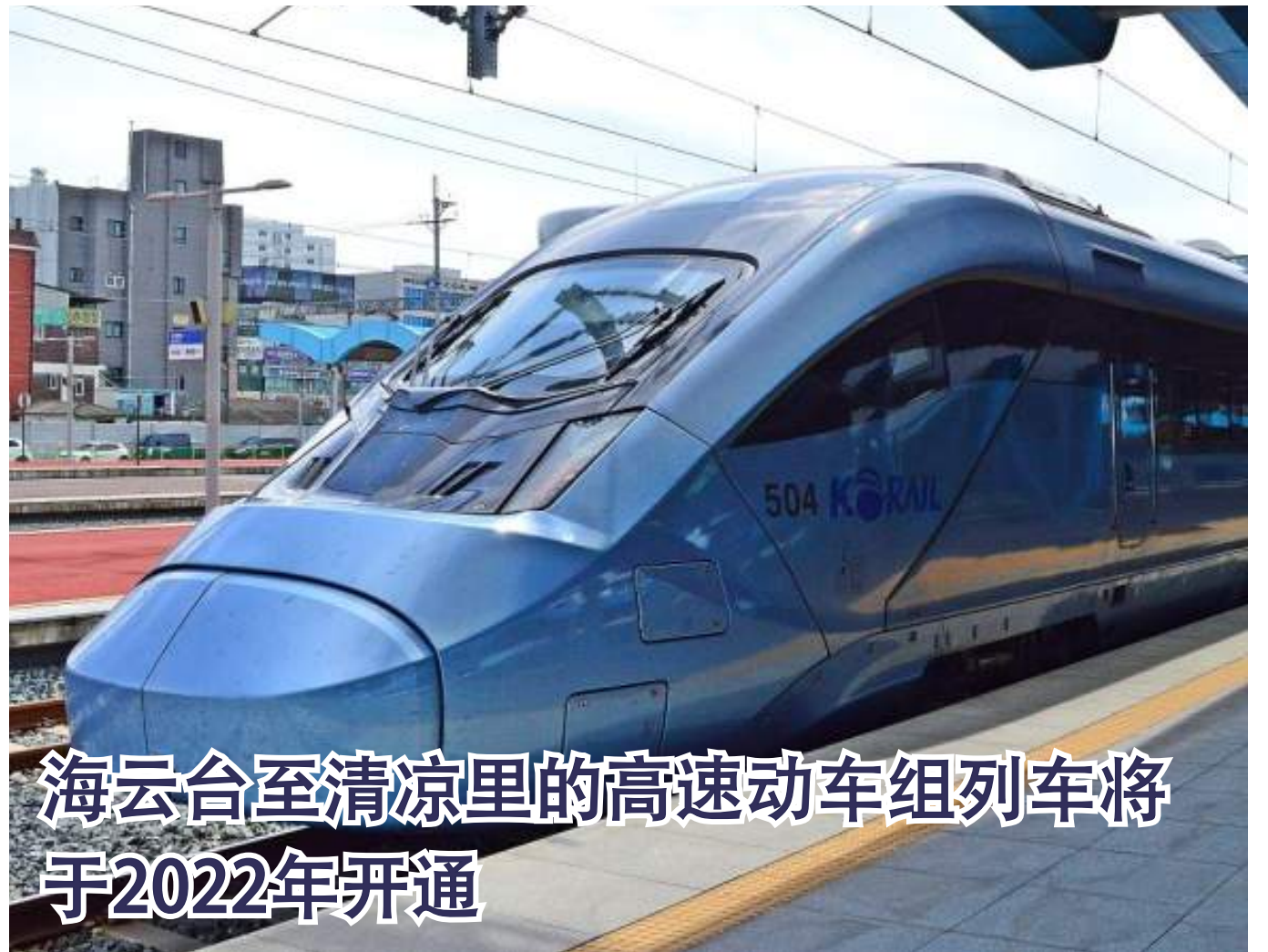
海云台至清凉里的高速动车组列车将于2022年开通

佐洞新区被冠上新的名字“海云台环保城区(GreenCity)”，经公寓住宅翻新与改造，会旧貌换新颜，转型成为智能城市。海云台区计划开展发展佐洞的研究工作，并制定出以民为本、未来指向型、可持续发展的城市发展方向。另外，于2021年6月实行“促进老房旧屋翻新与改造”条例，将针对翻新与改造提供系统化且实质性的支持。