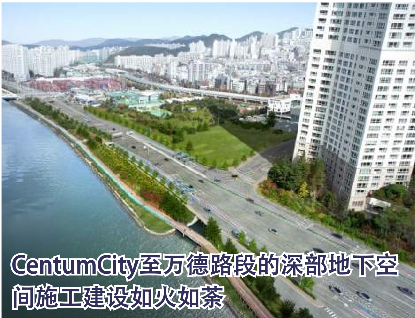
CentumCity至万德路段的深部地下空间施工建设如火如荼

新海云台站成为高速动车组列车(KTX EMU-260)的停靠站点，这让乘坐东釜山圈铁路的乘客能够快速抵达首尔圈，也将促进海云台地区经济和观光业的振兴。铁路运营线路包括东海线(釜田—海云台—蔚山—浦项—东海—江陵)和中央线(釜田—海云台—新庆州—永川—原州—清凉里)，预计在2022年下半年通车。