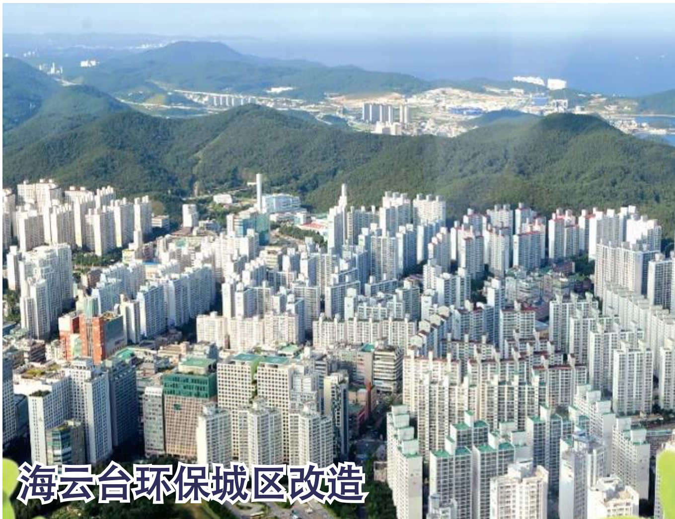
海云台环保城区改造

海云台区靠自己的力量，于2019年推进开展了城铁2号线“奥西利亚站(OSIRIA)”延长线工作，而釜山市也在今年的“釜山市城铁交通网构建与翻修建设规划”中反映了该内容。城铁2号线延伸至奥西利亚站，将解决交通拥堵问题，通往市中心的交通会更加便利，还有望搞活地方旅游发展。