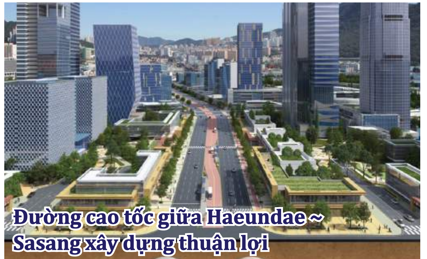
Đường cao tốc giữa Haeundae ~ Sasang xây dựng thuận lợi

Nếu đường hầm lớn nối khu vực Đông•Tây Busan được xây dựng, sẽ giúp giải quyết vấn đề tắc nghẽn giao thông kinh niên trên đường hiện nay. Đường hầm khứ hồi dài 9,62km, với 4 làn xe từ Phường Jaesong-dong đến Phường Mandeok-dong thuộc Quận Buk-gu, đã được thi hành và công trình đang trong đỉnh điểm, với mục tiêu là sẽ khánh thành là vào tháng 11 năm 2024.