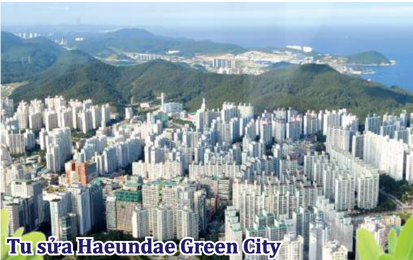
Tu sửa Haeundae Green City

Quận Haeundae-gu đã tự xúc tiến 'mở thêm Tuyến Osiria' của Tuyến số 2 Đường sắt Đô thị vào năm 2019 và Thành phố Busan cũng đã phản ánh nội dung này trong 'Kế hoạch Chính đôn Xây dựng lại Mạng lưới Đường sắt Đô thị Busan' năm nay. Nếu Tuyến số 2 Đường sắt Đô thị được nối thêm đến Osiria, thì tình trạng tắc nghẽn giao thông sẽ được giải quyết và khả năng tiếp cận trung tâm thành phố được nâng cao, cũng như kỳ vọng du lịch địa phương sẽ được thúc đẩy phát triển.