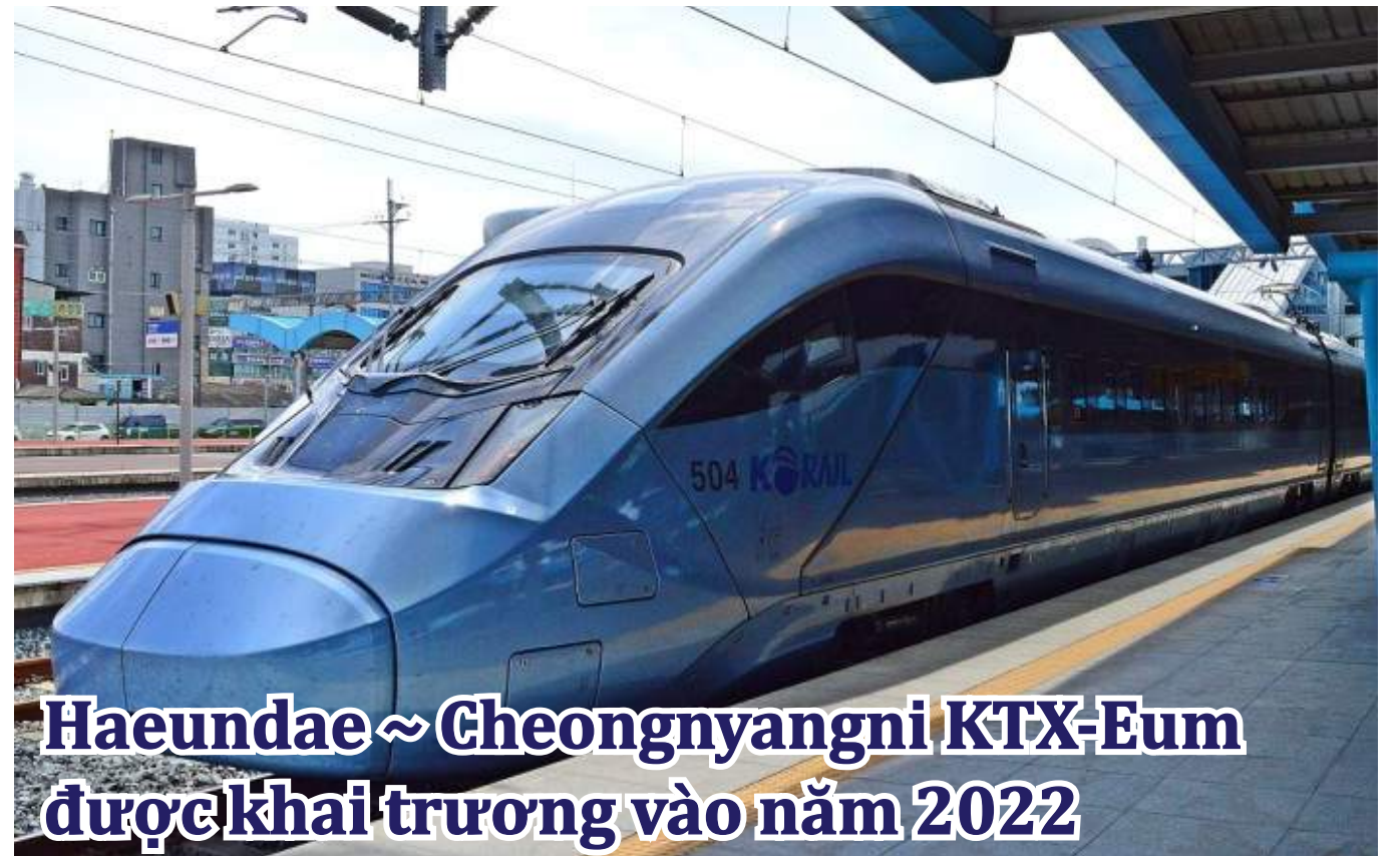
Haeundae ~ Cheongnyangni KTX-Eum được khai trương vào năm 2022

Khu Đô thị mới Jwa-dong được đổi tên mới là Haeundae Green City và thông qua tu sửa các tòa chung cư sẽ đổi mới thành phố thông minh. Quận Haeundae-gu sẽ chuẩn bị phương châm phát triển đô thị bền vững và hướng đến tương lai có người dân là trọng tâm, bằng cách thực hiện các dịch vụ nghiên cứu để phát triển Phường Jwa-dong. Ngoài ra, đã thi hành điều lệ thúc đẩy tu sửa nhà chung cư tập thể lâu đời vào tháng 6 năm 2021, và dự định sẽ hỗ trợ một cách có hệ thống và thiết thực cho việc tu sửa.