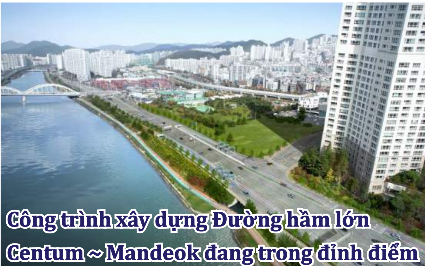
Công trình xây dựng Đường hầm lớn Centum ~ Mandeok đang trong đỉnh điểm

KTX-Eum sẽ dừng ở Ga Haeundae mới. Khách sử dụng đường sắt khu vực Đông Busan sẽ có thể đến thủ đô nhanh hơn và sẽ thúc đẩy phát triển du lịch và kinh tế khu vực Haeundae. Tuyến đường vận hành của Tuyến Donghae(Bujeon ~ Haeundae ~ Ulsan ~ Pohang ~ Donghae ~ Gangneung) và Tuyến Jungang (Bujeon ~ Haeundae ~ Singyeongju ~ Yeongcheon ~ Wonju ~ Cheongnyangni) sẽ được khánh thành vào 6 tháng cuối năm 2022.